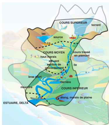
"Illustration 1" Evolution d'un fleuve de la source à la mer CRCK du Centre