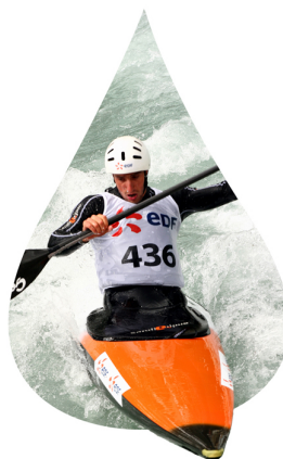
"Illustration 1" Tony Estanguet à Bourg-St-Maurice Sébastien TESTER

Lorsque Tony Estanguet - 65% de masse corporelle en eau- décide de passer une porte, son cerveau - 75% d'eau - ordonne à ses muscles - 75 % d'eau - de se contracter. L'énergie dégagée par la dégradation de molécules énergétiques - 2 molécules d'eau sont consommées dans le cycle énergétique de Krebs- est apportée par le sang - 83% d'eau - qui évacue les toxines produites vers les reins. Tony peut alors tirer sa pale dans l'eau du bassin d'eau vive.