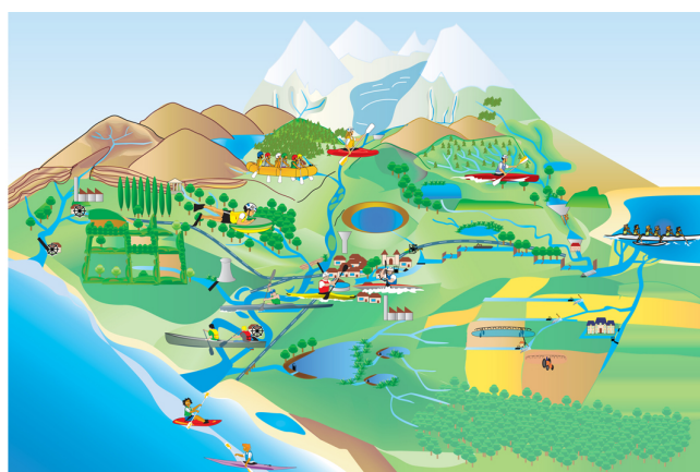
"Illustration 3" Les différentes pratiques du Canoë-Kayak s'épanouissent sur une grande variété de sites CRCK du Centre